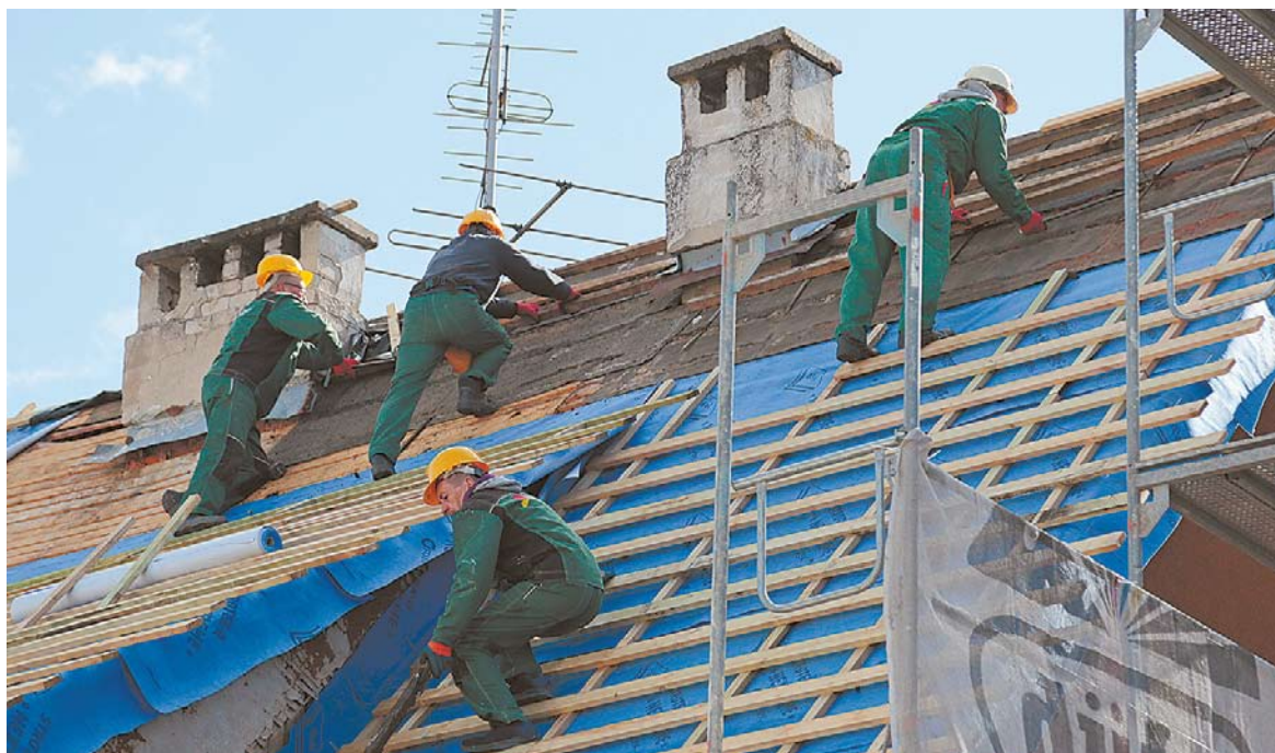
Antrasis pagal populiarumą sektorius, kuriame dirba Artimųjų Rytų piliečiai, yra statybų.