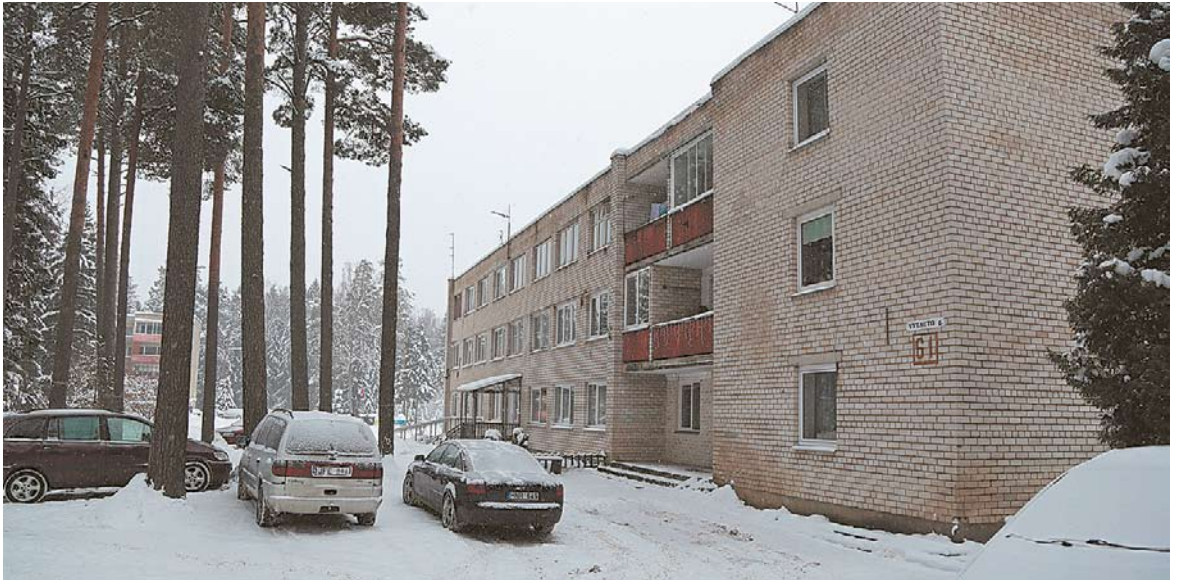
Pusiaukelėje tarp Kazlų Rūdos ir Jūrės buvusį mišką, kuriame prie kelio buvo pastatyti du daugiabučiai, Jūrės kaimo gyventojai vadino Šalnyne.

Kada išsikūrė kaimas, dabar niekas nepasakys – manoma, jog XVIII a., kai į dabartinį Kazlų kaimą iš Mozūrijos krašto atsikėlė Kazlų šeima ir pelkėtose vietose atrado geležies rūdos. Ji buvo perdirbama ir Jūrės kaime, netoli dabartinio tilto, čia anksčiau dar būdavo randama geležies gurvulių. „O toliau, prie upės tilto, gal prieš porą šimtų metų, pečių, faleriku vadintą, geležiai lydyt kūrėno“, – 1976 metais rašė D. Draugelytė-Stankevičienė.