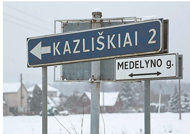
Pelkėtas miškas prie Kazliškių kaimo buvo vadinamas Barsukyne. Dabar čia užtventkas Jūrės upelis.

– Sugedo šeimos automobilis. Jis ryte lengvai užsivedavo, tačiau nuvažiavus keletą kilometrų išilęs variklis imdavo trūkti ir vėliau visiškai užgesdavo. Atidaviau automobilį remontuoti į autoservisą. Už remontą sumokėjau keletą šimtų eurų. Savaitę automobilis dirbo gerai, tačiau vėliau atsirado tokie patys variklio darbo trūkumai, kurie buvo iki remonto. Autoserviso vadybininko paprašiau, kad neatlygintinai pašalintų atsinaujinusį gedimą arba grąžintų už remontą sumokėtus pinigus. Vadybininkas nesutiko nė su vienu iš variantų.