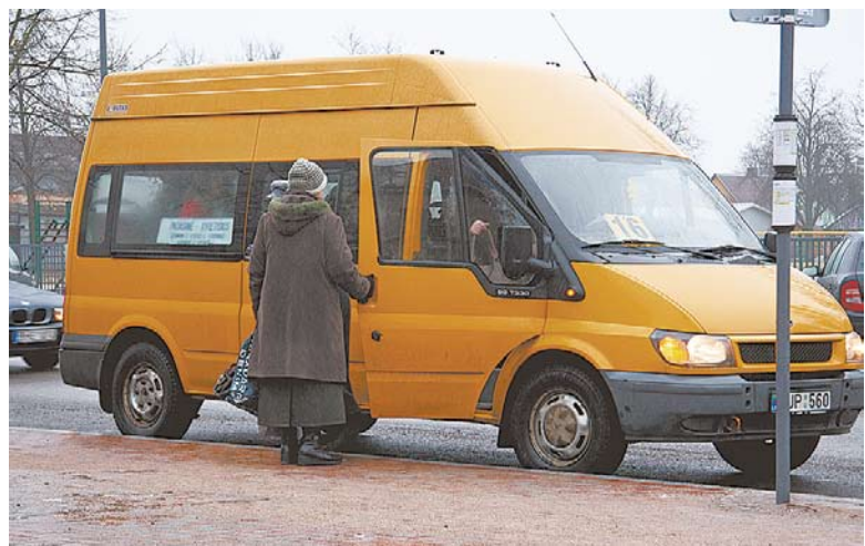
Keleivių srautui sumažėjus, dienos pabaigoje vairuotojai skaičiuoja bilietų pardavę vos už 10 ar 15 eurų.