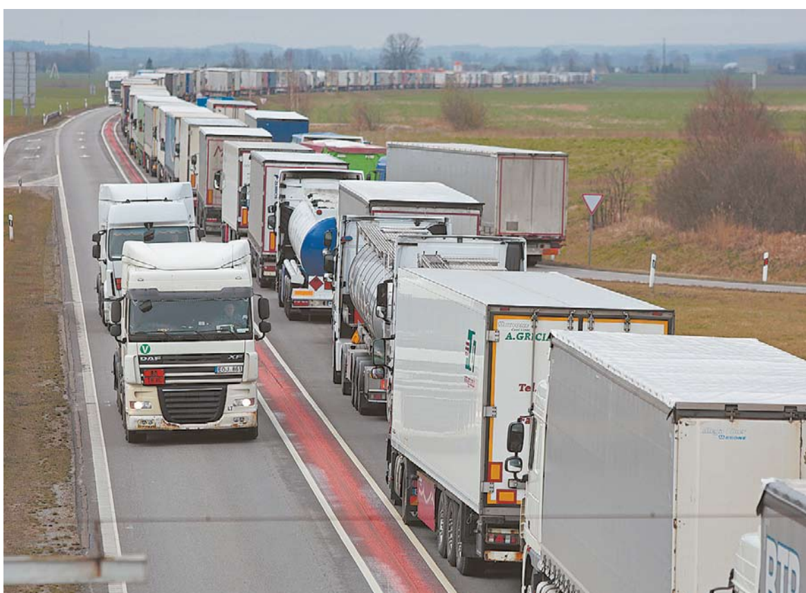
Suvalkijos regione imigrantai iš trečiųjų šalių dažniausiai įsidarbina tarptautinių reisų vairuotojais.