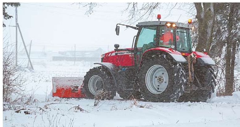
Kai kurie gyventojai į pagalbą kvietėsi ūkininkus.