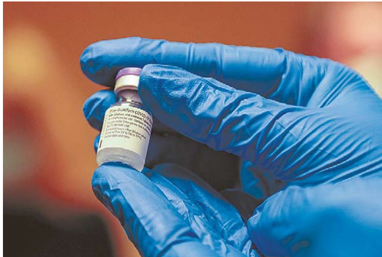
COVID-19 vakcina buvo sukurta per rekordiškai trumpą laiką, tačiau nepaisant to, yra saugi naudoti.

– Dar prieš 100 metų buvo visiškai įprastas dalykas – vaikų mirtys nuo infekcinių ligų. Žmonės susigyveno su difterija, tymais, kokliušu, raupais, nors ir bandydavo išvengti susirgimų, ypač raupų, kurie jei nenumarindavo, palikdavo baisias žymes ant kūno. Pirmoji pasaulyje sukurta vakcina buvo būtent nuo raupų. Tai pirmoji infekcinė liga, kuri išnyko dėl to, kad visos šalys ėmė skiepyti. Raupų infekcijos šiandien gamtoje nebeaptinkama ir tai yra vakcinos nuopelnas. Štai jums ir atsakymas, kodėl verta ir reikia vakcinuotis.