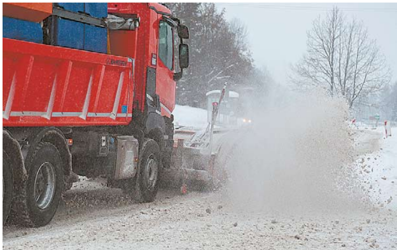
Valytuvai dirbo keliuose nuo 4 val. ryto.