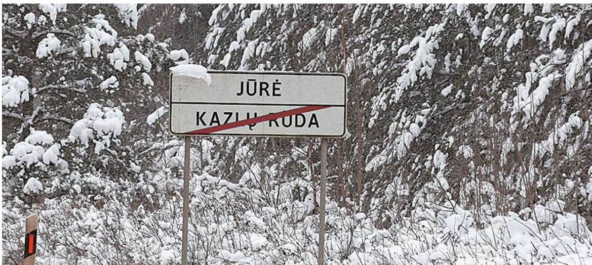
Jūrės kaimo vardas kilęs nuo netoliese tekančios Jūrės upės pavadinimo.