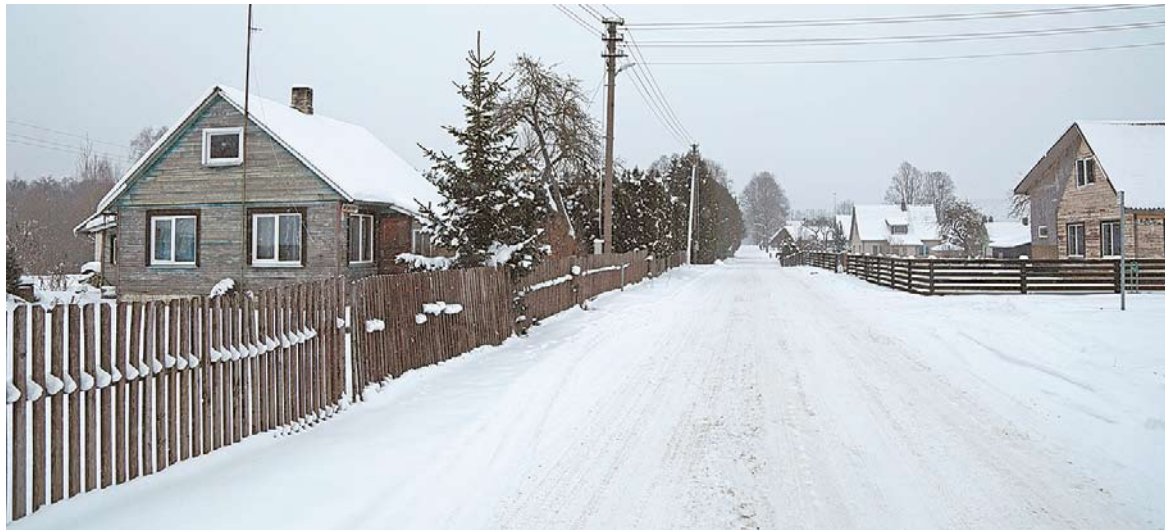
Manoma, kad Jūrės kaimas buvo įkurtas dar XVIII a.