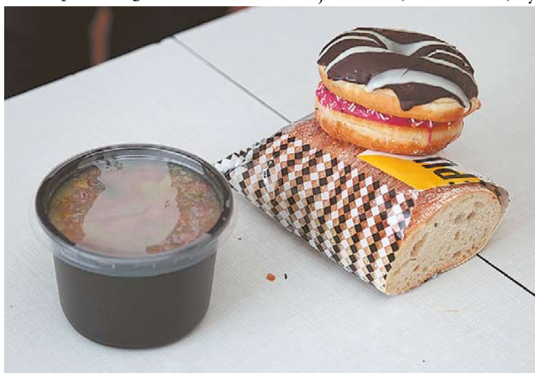
Valgykloje-kavinėje „Sotas“ darbo dienomis parengiama daugiau kaip po 30 porcijų sriubos maisto stokojantiems žmonėms.