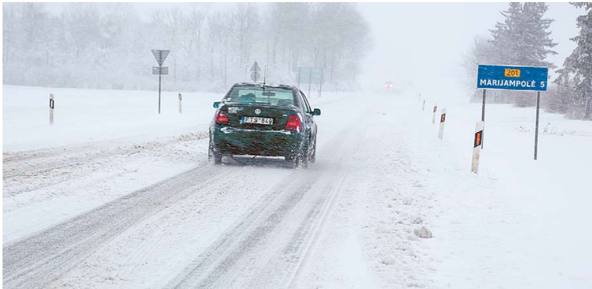
Keliumi Marijampolė–Kalvarija teko važiuoti labai lėtai.

Žiema antradienio rytą į Suvalkiją grįžo su trenksmu. Kur pažvelgsi, visur balta – tokio pasakiško vaizdo seniai neregėjome. Bet su grožiu ir – nepatogumai. Sniego iki kelių, o nuošalesnius sodybų, sodų bendrijų ar atokesnių kaimų kelelius net įžiūrėti sunku. Tie, kas gyvena atokesnėse vietovėse, antradienio rytą į darbą neišjudė, kol į pagalbą su traktoriais neatvažiavo ūkininkai ar kelius valančios tarnybos.